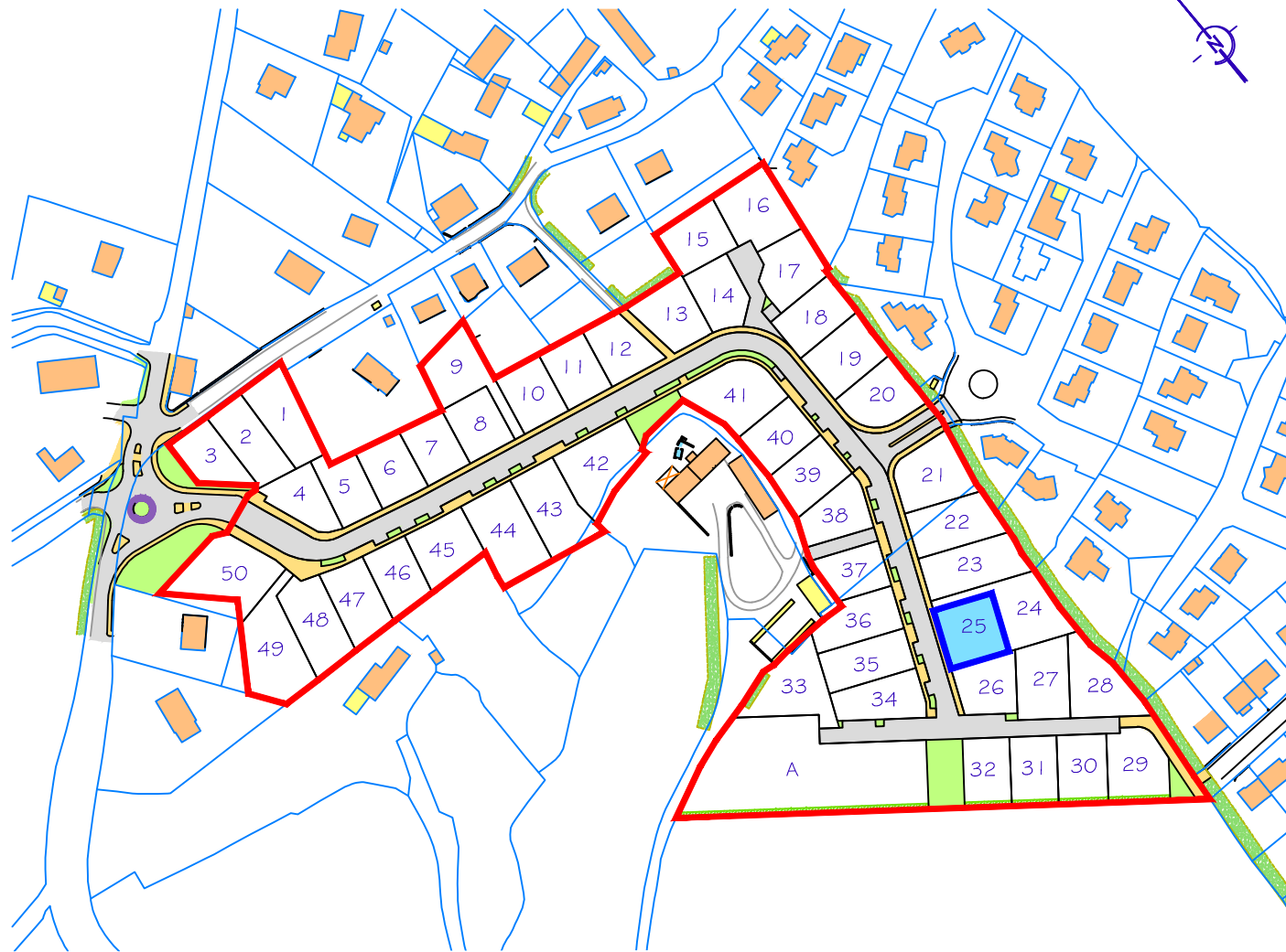
Situation dans le lotissement - Echelle : 1/2500